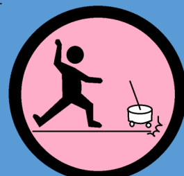
ハーネスを離しても緊急停止