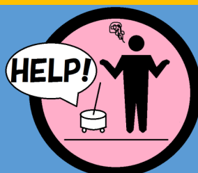
ワンタッチ救援要請